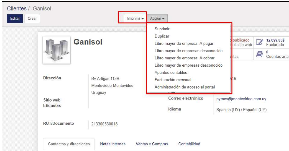
Figura 7: Ficha del cliente – Módulo de Contabilidad / Clientes