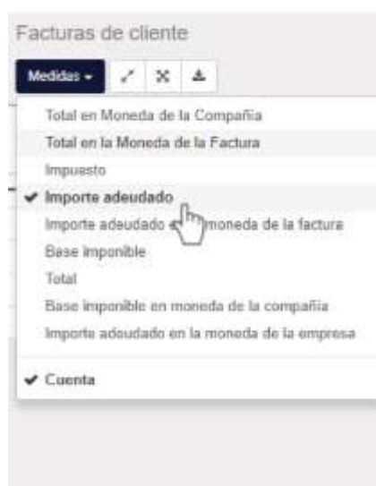
Figura 2: Medidas de Análisis