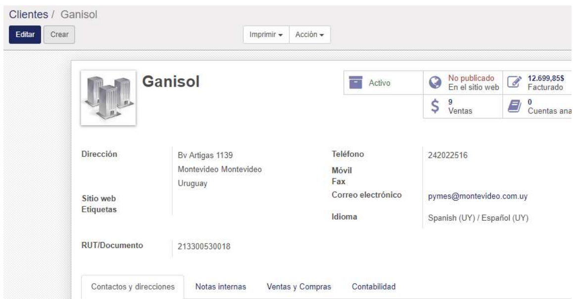
Figura 6: Ficha del cliente – Módulo de Contabilidad / Clientes