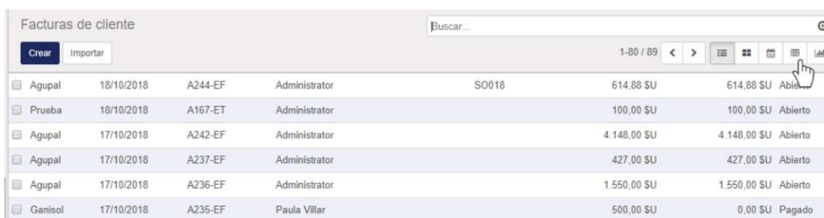
Figura 1: Facturas de cliente