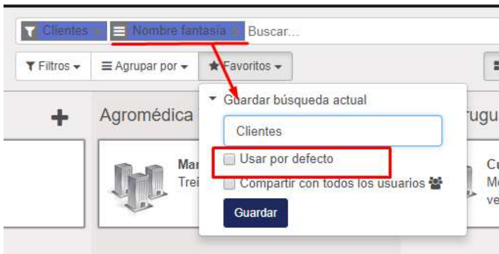
Figura 4: Favoritos - Módulo de Ventas